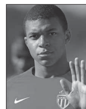
largohet nga Monako përfundimisht.

Pas shitjes së Moratas, transferimit të Neymar, tashmë ka mbetur Mbappe. Pasi humbi Superkupën franceze një javë më parë, Mbappe mund të ketë vendosur të