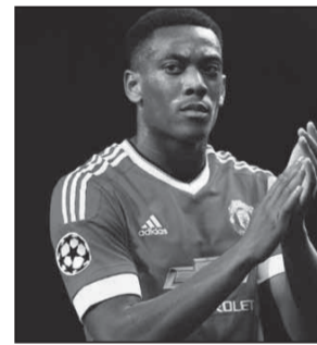
Zikaltrit të cilët nuk janë gati të pranojnë një ofertë poshtë 50 milionë euro.