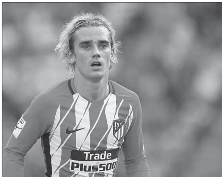
ekzekutiv të bardhekuqve, Miguel Angel Gil Marin, se nuk do të përpiqet ta kryejë këtë operacion të bujshëm. Duke mar-

rë parasysh interesin e madh të klubeve, Atletico Madrid para një muaji e ngriti nga 100 në 200 milionë euro klauzolën e largimit të sulmuesit. Bartomeu, kështu, ka telefonuar drejtuesin madrilen vetëm për ta pyetur për gjendjen aktuale të lojtarit dhe nëse ekziston mundësia për ta blerë. Gil Marin i është përgjigjur se klubi do të vuante shumë nëse Grizman do të largohej, sepse dënimi i FIFA-s me ngrirjen e merkatos hyrëse nuk e lejon ta zëvendësojë. Bartomeu ka kuptuar se Atletico Madrid nuk do të hynte kurrsesi në negociata për shitjen e 24-vjeçarit, madje as për shifrat e përmendura në medie, kështu që ka vendosur të ruajë miqësinë ndërmjet klubeve. Kjo është diçka shembullore!