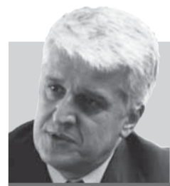
Nga Pandeli MAJKO

N ë Prishtinë po luhet një politikë e cila po shkon drejt absurdit. Kërkesa për anulimin e Gjykatës Speciale po prodhon paqartësi dhe frikë për të ardhmen. Për arsye që kishin kuptim, hyja tek ata që kishin rezerva për krijimin e Gjykatës Speciale për krimet në Kosovë. Arsyetimi nuk qëndronte në mohimin e asaj që ndodhi në Luftën e Kosovës. Ai kishte të bënte me dallimin e përmbajtjes së akteve që serbët dhe shqiptarët kryen kundër njëri tjetrit, sidomos në periudhën e pasluftës. Në këtë histori dallimi i aksionit dhe reaksionit është i rëndësishëm. Ky dallim nuk mund të mbyllet me shprehjen se "krimi është krim, në çdo rast" (!). Edhe kodet penale më moderne e bëjnë dallimin. Aktualisht, në politikën e Prishtinës kanë filluar, me dhe pa të drejtë, të diskutojnë "drejtësinë" dhe raportin e vështirë historik që krijon Gjykata Speciale për shtetin e Kosovës.