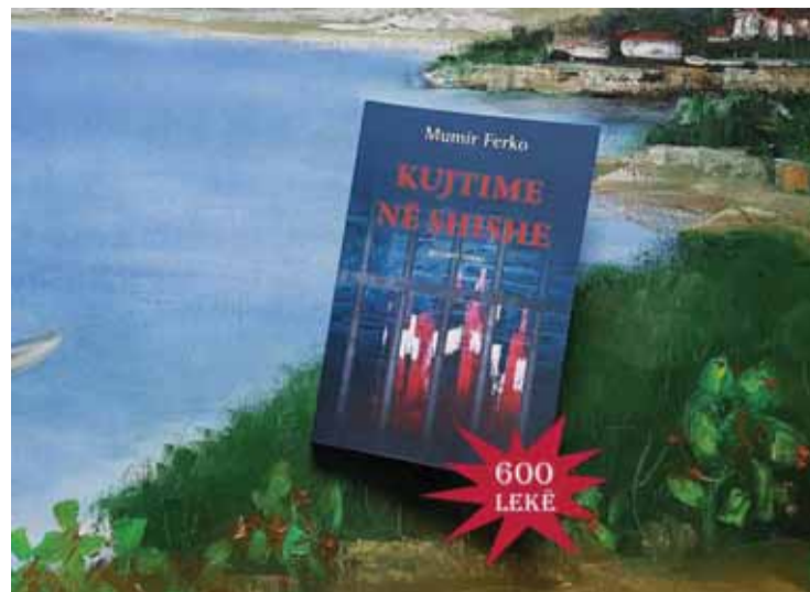
“Kujtime në shishe”. Autori Mimir Ferko eksploron artistikisht në një zonë tepër delikate, që pa ngurrim mund të quhet tabu.

Novela, që tashmë “vështron” më në brendësi të teatrit të luftës dhe fokusohet me realizëm e vërtetësi në çeljen e kapitujve të rinj të këtyre marrëdhëniesve, sidomos ndër brezat e rinj të pafajshëm për atë çka ndodhur, pa e bartur armiqësinë brez pas brezi, por ama me