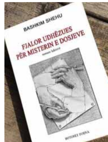
qendrën e të cilit është misteri i dosjeve, shprehje të marrëzisë së kontrollit totalitar.

identike dhe të njëkohshme që shoqërojnë zhurmën për këtë linjë korrupsioni, një teori konspirative për një zyrë të fshehtë, reale ose imagjinare, për të cilën thuhet se lëviz çdo fije të ngjarjeve në Shqipëri... Të gjitha këto, ndërthurur me motive mitologjike nga më të ndryshmet, lidhen me njëra-tjetrën si shtigjet e një labirinti, në