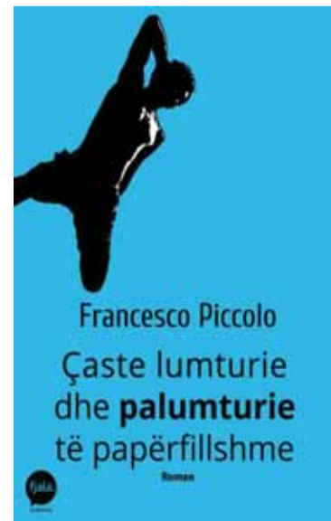
sh me vete gjithkund. FRANCESCO PICCOLO jeton dhe punon në Romë. “Çaste lumturie dhe palumturie të papërfillshme” në shqip e botoi Dudaj.

Dhe askush s’di ta rrëfejë më mirë se Francesco Piccolo, i cili me çastet që e përbëjnë jetën krijon një enciklopedi finoke e fort zbavitëse që mund ta marrë-