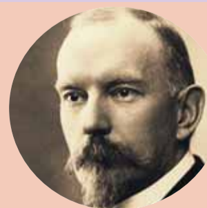
Lloji më i keq i armiqve janë lajkatarët. (Jules Renard)