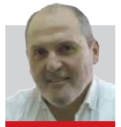
Nga Veton SURROI