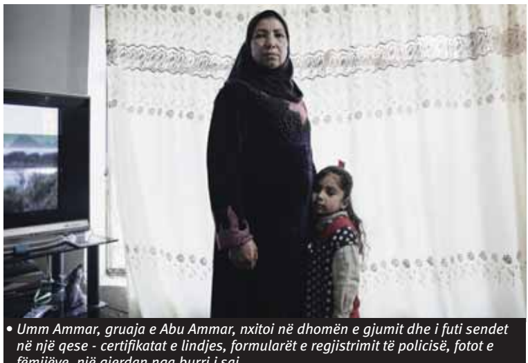
• Umm Ammar, gruaja e Abu Ammar, nxitoi në dhomën e gjumit dhe i futi sendet në një qese - certifikatat e lindjes, formularët e regjistrimit të policisë, fotot e fëmijëve, një gjerdan nga burri i saj

Ky shkrim është shkruar nga Anand Gopal, autor i librit "Asnjë njeri i mirë mes të gjallëve: Amerika, talebanët dhe lufta në sytë afgane". Teksti është botuar në "The Atlantic", i përkthyer dhe përshtatur nga "KDPolitik.com".