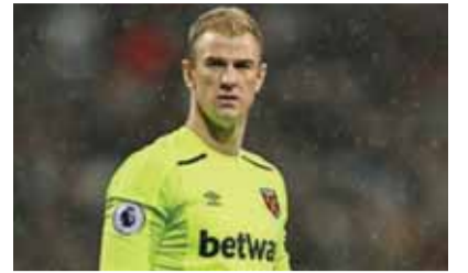
Hart, pasuesi i De Geas

Mbrojtësi i Napoli ka një kontratë deri në vitin 2021 me klubin e Aurelio De Laurentiis dhe e ka pagën 2 milionë euro, ndërsa klauzola për shitjen e tij jashtë Italisë është 70 milionë euro, derisa nga Juve thonë se Higuain nuk është në shitje, por nëse Çellsit ofron 70 milionë euro, atëherë situata do të ndryshojë