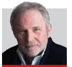
Nga Bernard GUETTA

Gjërat nuk do të ndryshojnë brenda natës, por vizita e Emmanuel Macron në Rusi, e caktuar për në 25 maj, mund të ndryshojë reagimin zinxhir të ngjarjeve që po ndodhin në botë. E gjitha filloi më 8 maj, kur Donald Trump njoftoi tërheqjen e SHBA nga marrëveshja bërthamore e firmosur në vitin 2015 me Iranin, nga fuqitë e mëdha. Aleanca e Atlantikut është ndarë, sepse evropianët - duke filluar me Francën, Gjermaninë dhe Mbretërinë e Bashkuar - e kanë dënuar vendimin e Uashingtonit dhe janë gjendur në mospërrthje të plotë me aleatin e tyre amerikan, dhe më pranë Rusisë, Kinës e madje edhe Iranit, me vullnetin e tyre për të mos braktisur kompromisin e vitit 2015.