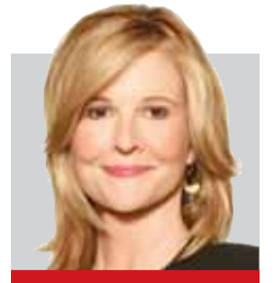
Nga Kathleen PARKER

Reklamata e Facebook të blera nga Rusia gjatë fushatës së 2016-ës dhe të publikuara nga Kongresi këtë muaj zbulojnë qëllimin e qartë për të bërë kërdi në Shtetet e Bashkuara dhe duhet t'i bëjnë amerikanët të jenë të kujdesshëm dhe të ndihen të turpëruar. Ata gjithashtu dërguan një mesazh të qartë amerikanëve për komplimentet e Presidentit rus Vladimir Putin: Ju ngatërroheni me mua, unë do të ngatërrohem me ju. Ne i kemi lejuar vetes të jemi të prekshëm ndaj një shfrytëzimi të tillë të mediae sociale duke dështuar të kontrollojmë pasionet tona të manipuluar lehtësisht dhe me vetëdijen tonë. Dhe presioni i vazhdueshëm i presidentit Trump ndaj mediae legjitime dhe padurueshmëria e bazës së tij për ta përqaftuar këtë mesazh, me siguri i shërbejnë mirë Putinit dhe punonjësve të tij.