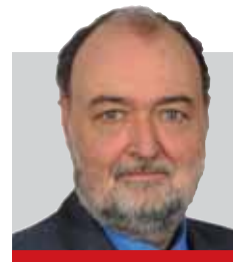
Nga Bernd JOHANN

Nëse kjo nuk bëhet, atëherë imazhi i Ukrainës do të dëmtohet edhe më shumë se tani, kur vendi vuan nga mungesa e reformave dhe ku lufta kundër korrupsionit ka ngecur. Të shpresojmë që politika ukrainase e ka të qartë, se sa po vihet në lojë besueshmëria e saj. Rasti Babtshenka shkaktuar irritime jo vetëm në Ukrainë por në masë të madhe edhe në botë. Këtu mund të ndihmojë vetëm zbardhja e plotë. (DW)