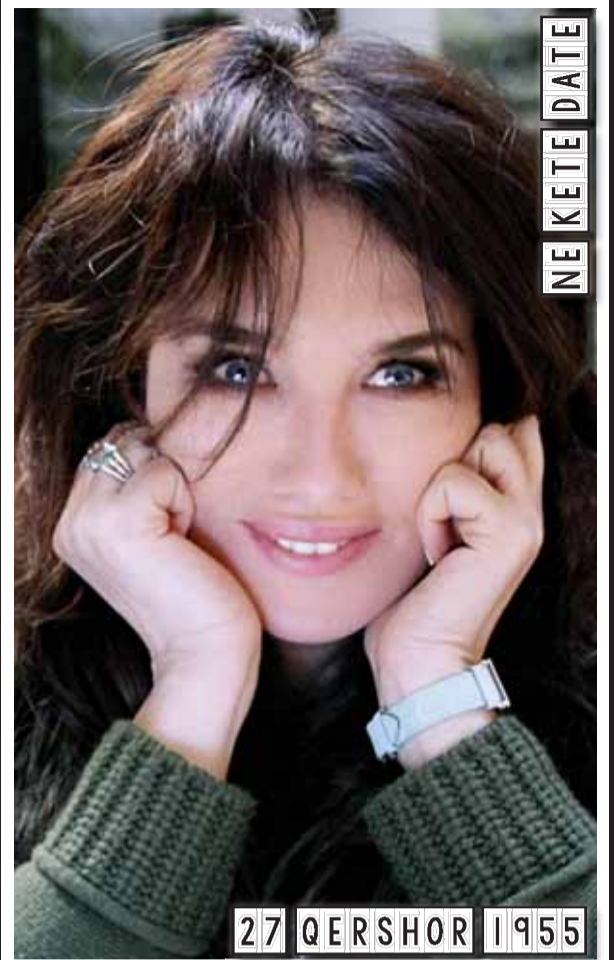
NE KETE DATE

ZGJIDHJET: D, NADIRI, NIKOS, AT, MK, LËFAR, ITENE, ZBRET, DAUM, J, RAXHA, KAMEO, NEKROLOGD, I PARI, ZOTON, KASABA, BEKIM, EDA, O, LIMIT, AMANI, XHI, AR, A, ATA, P, T, NELINA, OPI, INK, ARTRIT, DAC, METRO, TEPPELENASI, O, OZONI, IS, KANABISI, T, AMER, ATOMI.