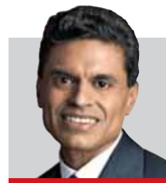
Nga Fareed ZAKARIA