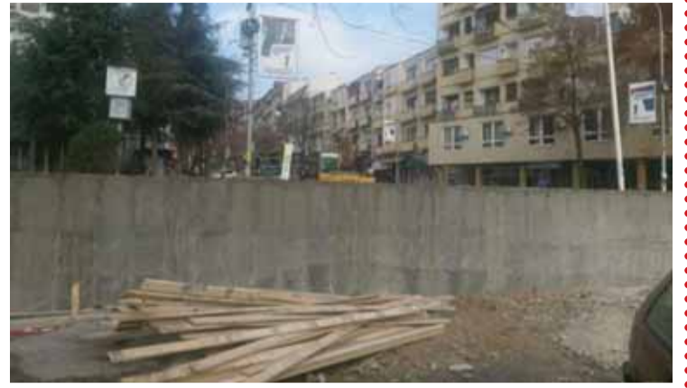
është rrenuar në shkurt të vitit 2017 pas një marrëveshje të arritur në

Mitrovicë dhe objekteve përreth, si dhe projektin për ta bërë rrugën "Mbreti Petar" ta kalueshme për këmbësorë", ka thënë ndër të tjerë kjo Zyrë. "Të gjitha punët pritet të përfundojnë në fund të këtij muaji", është thënë në deklaratë. Në fund të vitit 2016 komuna e Mitrovicës Veriore ka ndërtuar një mur të gjatë dy metra, çka ngjalli shumë reagime në Prishtinë. Muri