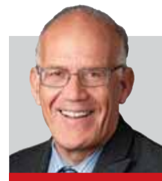
Nga Victor DAVIS HANSON

Zemërat evropiane mbi Donald Trump nuk është, siç pohohet, sepse ai dhe kombi që e zgjodhën atë janë të vrazhdë, por sepse ai dhe vendi i tij janë të nevojshëm më shumë se kurrë, për një kontinent që ka humbur rrugën e vet. (Hoover Institute)