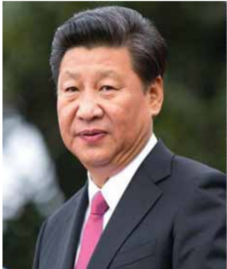
Shinzo Abe, krahasimi ishte i pashmangshëm. Fushata kundër Winnie gjithsesi ka

Diçka e ngjashme ndodhi edhe në 2013, kur Xi zhvilloi një vizitë në Shtetet e Bashkuara. Faqet e para të shtypit amerikan u hapën me krahasime të tilla, Jinping me Pooh dhe Obama me tigrin. Një vit më pas, në takimin e liderit të vendit komunist me homologun e tij japonez