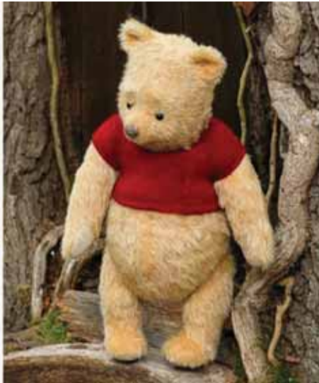
nisur që në verën e kaluar në Kinë me bllokimin e imazhit të tij në rrjete sociale.