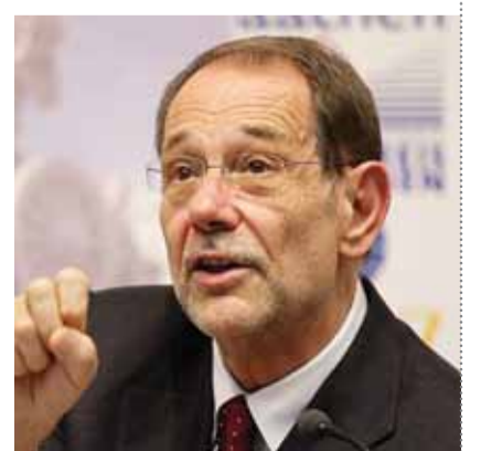
Zaev dhe Aleksis Cipras dhe kujton se ata të dy përballen me sulmet e forta nga opozita vendase.