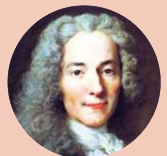
Qeveritë duhet të kenë edhe barinj edhe kasapë. (Volteri)

Një gazetar po interviston një plak me rekord jetëgjatësie 175 vjeç. Gazetari: Xhaxho, cili është sekretin i jetëgjatësisë suaj? Plaku: Në '97-ën kur Saliu... Gazetari: E dimë '97-ën. Sekretin e jetëgjatësisë duam! Plaku: Në '97 kur Saliu... Gazetari: Xhaxho e dimë, e dimë '97-ën, sekretin e jetëgjatësisë duam?! Plaku: Do më lesh ta mbaroj?! Në '97 kur Saliu ra nga pushteti, u bë një rrëmujë aq e madhe sa dikush më shtoi 100 vjet në dokumente! Ja ky është sekretin, se më plase!