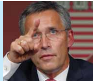
deklaroi sekretari i përgjithshëm i NATO s, Jens Stoltenberg.

e përfshirë anëtarësimin e barabartë në NATO. "Anëtarësimi në NATO do t'ju japë shans juve dhe fëmijëve tuaj siguri që vjen kur jeni pjesë e aleancës më të suksesshme në botë dhe do t'ju japë vendit tuaj votë të barabartë në diskutimet tuaja dhe deklarim të barabartë në vendimet tuaja",