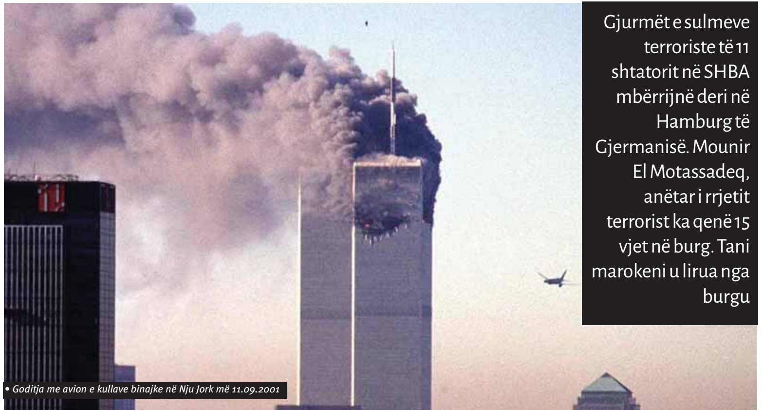
• Goditja me avion e kullave binjake në Nju Jork më 11.09.2001