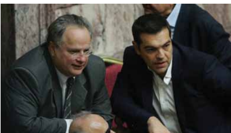
Athinë, 17 tetor - Kryeministri grek Alexis Cipras e pranoi dorëheqjen