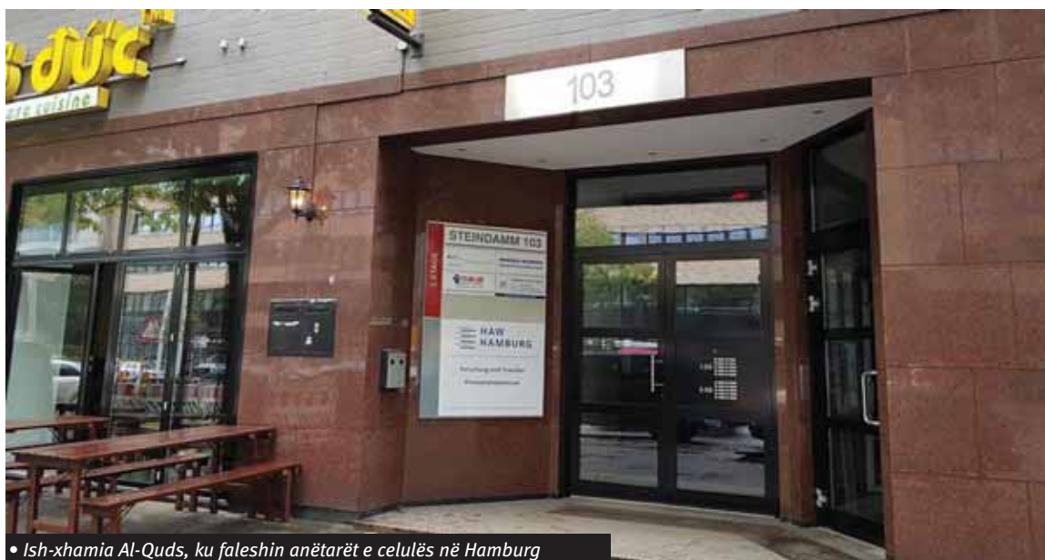
• Ish-xhamia Al-Quds, ku faleshin anëtarët e celulës në Hamburg