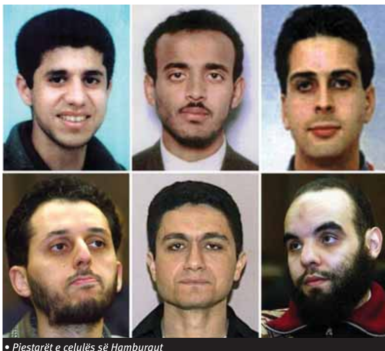
• Pjestarët e celulës së Hamburgut

intervistën e vetme që është publikuar deri tani.